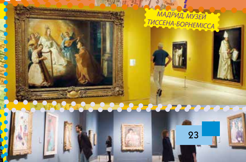
МАДРИД, МУЗЕЙ ТИССЕНА-БОРНЕМІССА