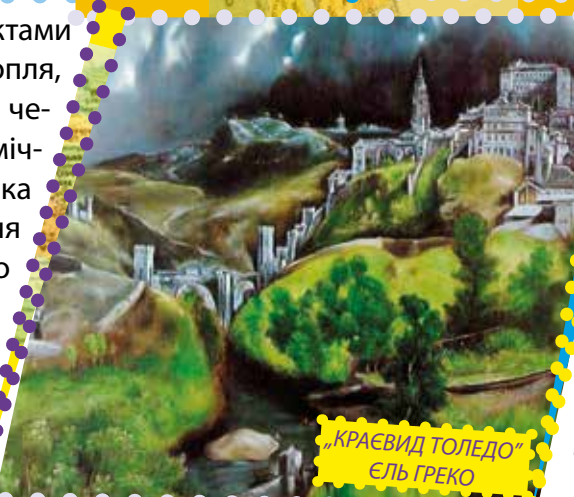
„КРАЄВИД ТОЛЕДО” ЕЛЬ ГРЕКО

У Каталонії туристу обов'язково запропонують густий м'ясний (ескулла) або рибний (порусальда) суп, смажені свинячі ковбаски з квасолею, куріпку по-каталонськи, асорті з морепродуктів (сарсуела)