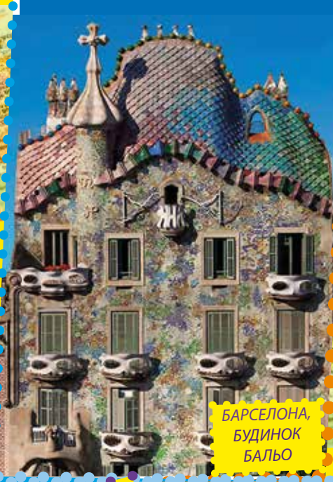
БАРСЕЛОНА, БУДИНОК БАЛЬО