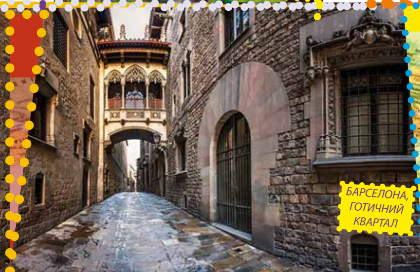
БАРСЕЛОНА, ГОТИЧНИЙ КВАРТАЛ