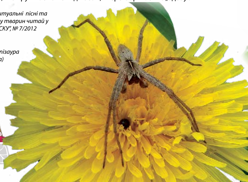
Павук пісаура (Pisaura)

Про ритуальні пісні та танці у тварин читай у „КОЛОСКУ“, № 7/2012