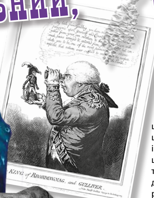
KING of BROBDINGNAG, and GULLIVER. in the People called Lilliput in the Kingdom of Lilliput.