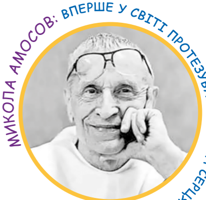
МЙКОЛА АМОСОВ: ВПЕРШЕ У СВІТІ ПРОТЕЗУВАВ КЛАПАНИ СЕРЦЯ