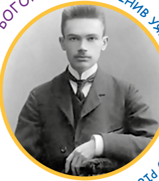
ОЛЕКСАНДР БОГОМОЛЕЦЬ: ЗМІНИВ УАВЛЕННЯ МЕДИКІВ ПРО РІСТ ПУХЛИНИ