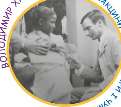
ВОЛОДИМИР ХАВКІН: ВІНАЙШОВ ВАКЦИНИ ПРОТИ ХОЛЕРИ І ЧУМНИ