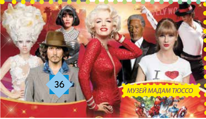
МУЗЕЙ МАДАМ ТЮССО

1 Голмс (Holmes) – латинську літеру H перекладаємо як Г відповідно до офіційної транслітерації українського алфавіту (від 27 січня 2010 року).